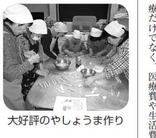
大好評のやしろうま作り

きれいにのびてきました。 参加者の皆さんからは「来年もやしようま作りをしたい」とのうれしい声もあり、楽しい時間を過ごすことが出来ました。