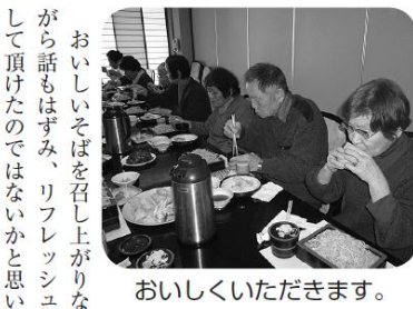
おいしくいただきます。

介護者交流会 社協では、毎月昼と夜の二回在宅で介護をしている皆さんに集まって頂き、楽しいレクリエーションや勉強会を行い交流を深めています。 今年初の交流会は、すずみし荘においてそば打ちをしました。恒例となっているそば打ちですので、お店で出でくるような出来栄で、味も大満足です。