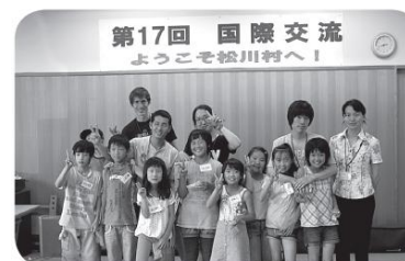
小学生ボランティア教室国際交流(信大留学生)