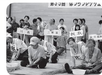
はつらつレクリエーション交流会