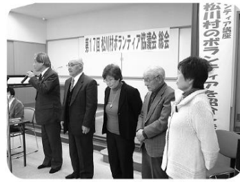
一年間よろしくお祈りします。

平成24年2月3日(金)第17回松川村ボランティア協議会総会が松香荘で開かれました。 23年度は3月11日の東日本大震災で始まり、一年間驚き悲しみ励まし合った年でした。 不安の多い中でしたが、日々の活動を続けながら、自分たちが元気でいようと一年間活動を続けて来ました。 平成24年度の活動計画として地区ふれあい会での認知症講座開催の推進をあげ、村地域包括支援センターと連携していく。