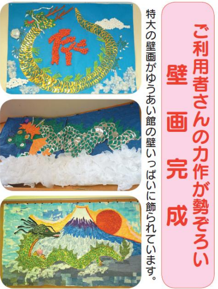
ご利用者さんの力作が勢ぞろい 壁画完成