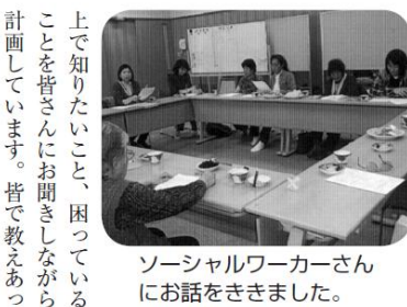
ソーシャルワーカーさんにお話をさきました。

ヘルパー情報 お一人暮らしの方の交流会「みちくさ交流会」が12月12日、すずみし荘にて行われました。今回はヘルパーが、身近にある食材で、簡単にできる料理講習を行い、皆さんにはフライパンでできる茶わん蒸しや、ミルクもちを作って味わっていただきました。皆さん楽しみながら作って下さいました。台所に立つのも短時間で、冷蔵庫にある物で代用でき、皆さん喜ばれていました。私達ヘルパーは、ご利用者さん宅に伺い、ご希望などお聞きしながら、冷蔵庫にあ