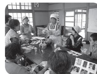
地区ふれあい会(非常食作り体験)