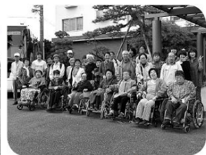
ホテルの前で記念の一枚