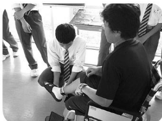
松川中校風委員会車イス体験