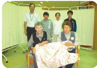
松川小児童会の皆さんと記念の一枚「ありがとう」

松川小児童会児童会の皆さんから、食食用エプロンを15枚、松川中学校生徒会の皆さんから、マグカップ15個をそれぞれいただきました。