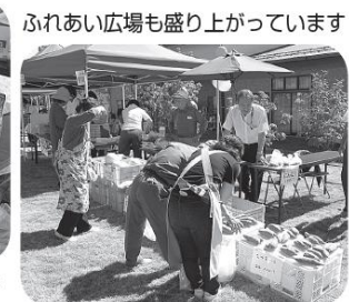
ふれあい広場も盛り上がっています