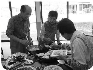
大勢で作る料理は楽しい

十月十一日(金)に松香荘で、まめまめ会食交流会がありました。 この会は、日頃顔を合わせる事がない、まめまめ会当ご利用者さんとボランティアさんの交流会で、年に二回開催しています。