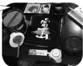
おいしくいただきました