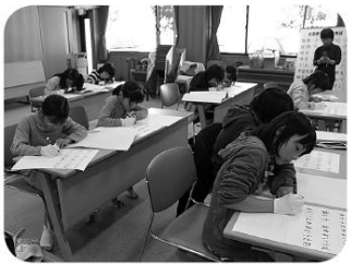
1分間に何文字書けるか挑戦

十一月の小中ボラ教室では、松川要約筆記サークルの皆さんに教わりながら、要約筆記体験をしました。