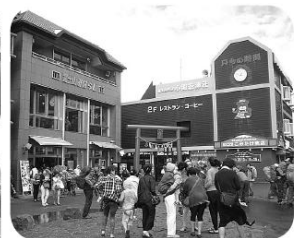
五合目には、大勢の観光客