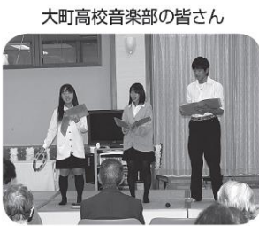
大町高校音楽部の皆さん

午前中には、松川中学校合唱部の皆さん、大町高校音楽部の皆さんによるコンサートが行われ、ステキな歌声がゆうあい館中に響いていました。