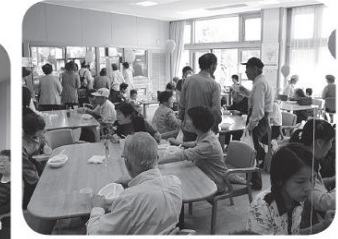
ゆうあい祭りにはかせない美味しいカレーライス

また、例年大好評の針・マツサージや各種露店、バザーなど一日様々な催し物で皆さんをお迎えし、好評をいただくことができました。