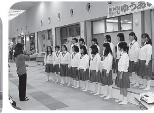
松川中合唱部の皆さん

十月六日(日)、松川村福祉プラザゆうあい館を主会場に、第14回松川村ゆうあい祭りが開催されました。 例年大勢の皆さんにご来場いただいております。様々な催し物や美味しいカレーライスを喜んでいただいております。