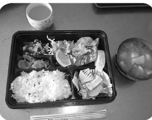
おいしいお弁当の昼食

ある利用者さんは、「みんなと食べるお寿司も余計に美味しい。」と感想をおっしゃっていました。来年も、皆さんと一緒に、美味しいお寿司を食べましょう!