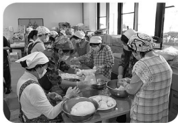
3斗のご飯があつという間に五平餅に

今回の見本市を通して、様々な声をいただくことができ、また、松川村の活動を大勢の方に知っていただく、貴重な機会となりました。