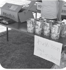
気仙沼産の品物も大好評

大勢の皆さんにご協力をいただきまして、盛大に開催することができ、本当にありがとうございます。来年もぜひお出かけ下さい。