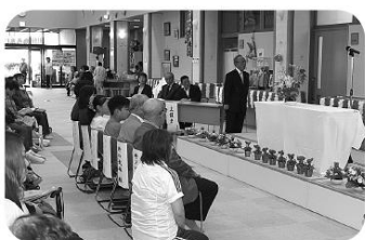
ゆうあい祭りの参加者が見守る中での表彰式

〓松川村立松川中学校生徒会様 収集活動を通じて福祉用品を寄付され高齢者、障害者に思いやり溢れるやさしい地域づくりのためにご尽力いただいています。