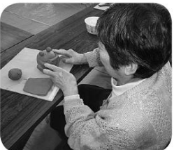
完成までもう少し