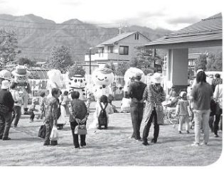
子どもにも大人にも大人気!!

午後のふれあい広場では、大北のキャラクターが集合し、インタビュやふれあいなど、楽しいひとときを送りました。ほほえましい動きに、皆さんも笑顔で楽しんで下さいました。