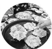
熱々のお好み焼きの味は最高!!

食事中も、利用者さんから「いつも美味しなお弁当をありがとうございます。楽しみにしています。」と直接ボランティアさんへお話が盛り上がりました。 短い時間でしたが和やかな交流ができました。