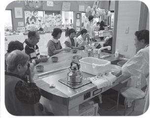
お抹茶サービス、「ホッと一息」