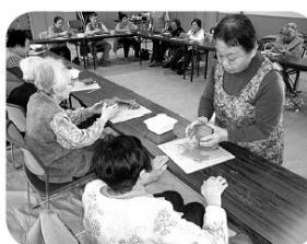
ゆっくり形を作っていきます