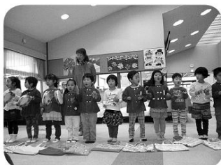
たくさんの元気を届けてくれました。