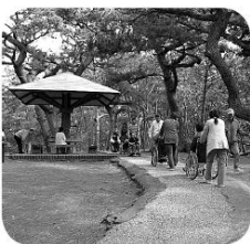
三保の松原を散策

今回は、どちらの旅も富士山を満喫する内容でした。たまに顔を出す富士山に、感動も一潮でした。様々な体験をしながら交流を深めていただいています。来年もご参加ください。