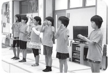
小中ボラ教室 手話の歌「花は咲く」

午後のふれあい広場では、大北のキャラクターが集合し、インタビュやふれあいなど、楽しいひとときを送りました。ほほえましい動きに、皆さんも笑顔で楽しんで下さいました。