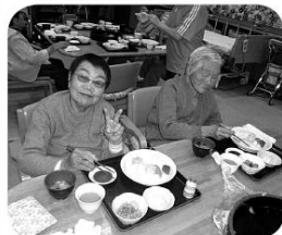
「とってもおいしいよ」

社協では、十一月十一日から一週間、お寿司週間を開催しました。 毎年ご好評いただいているこの企画、今年も腕前ピカイチの職人の方(何と御年80歳!)いつもお招きし、皆さんに楽しんでいただきました。