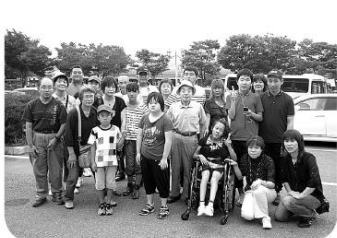
富士山をバックに「ハイパチリ」

二日目は、今年世界文化遺産に登録された富士山の五合目に行きました。お天気は、快晴というわけにはいきませんが、間近に富士山を見て、富士山の偉大さを感じることができました。二日間、ゆっくりと過ごしていただけました。