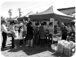
大勢の方にお買い上げいただきました。

今回の見本市を通して、様々な声をいただくことができ、また、松川村の活動を大勢の方に知っていただく、貴重な機会となりました。