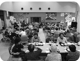
今年のゆうあい寿司も大盛況

マグロにホタテ、サーモンに甘えび、巻き寿司各種をおかわり自由ということで、板前さんの前には行列が出来ることもたびたび、新鮮なネタに皆さん喜ばれていました。