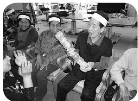
シャカシャカふつて豆を落とします

り、皆さん夢中で競技を行い、大変盛り上がりました。笑顔あふれる楽しい運動会となりました。