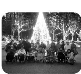
ステキなイルミネーションの前で