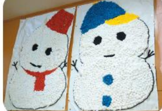
かわいい雪だるまに笑顔がこぼれます