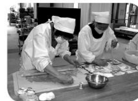
何ができるか楽しみです

恒例イベント、やしろうま作りを今年も行いました。2月19日(水)、21日(金)にはやしろうま名人をお迎えして伝統のやしろうまの実演を見学させて頂きました。名人の作るやしろうまはとても繊細な桜や可憐な花の絵柄でそれはそれは見事な出来栄でした。