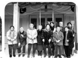
初詣をおえて記念の一枚