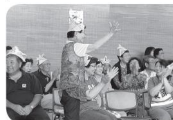
はつらつレクリエーション交流会