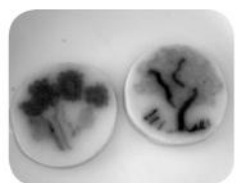
色あざやかで食べるのがもったいない

ご利用者さん達も「こんなにきれいだから、食べるのがもったいないよ」と大満足の様子でした。また、このやしろうまを食べると春の訪れを感じるそうです。名人の皆様、本当にありがとうございました。