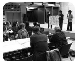
会場に歌声が響きました

日頃の様子を模造紙にまとめたいたり、実際の活動をDVDにまとめたものを流していただいたり、区で好評のお茶うけを紹介、試食したり、実際にやっているゲームや歌など実演していただいたりと、会場のあちらこちらで、情報交換やアイデア収集をしていただくことができました。普段はなかなか他地区の様子を見る機会が少ないので、皆さんお互いに熱心に質問し合っていました。