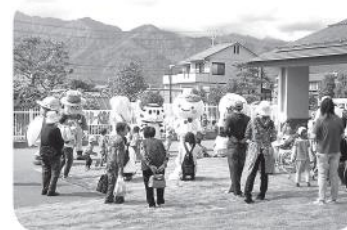
第14回松川村ゆうあい祭り