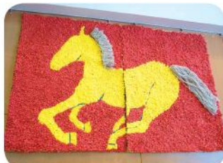
今年の干支は勇ましく!!

この作品は、ゆうあい館を利用されているご利用者さんが、レクリエーションの時間にご自分で下さったものです。季節ごとかわる壁画で、ゆうあい館の壁はいつも華やかです。