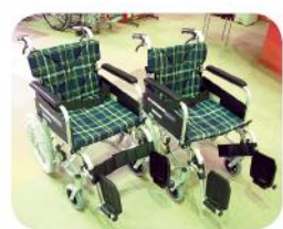
ありがとうございます