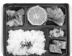
まめめ弁当でご利用者さんのもとへ