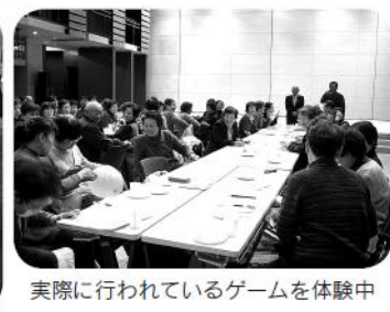
実際に行われているゲームを体験中