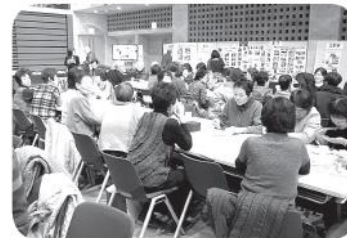
第8回地区ふれあいサミット