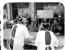
名人技に皆さんのまなざしも真剣