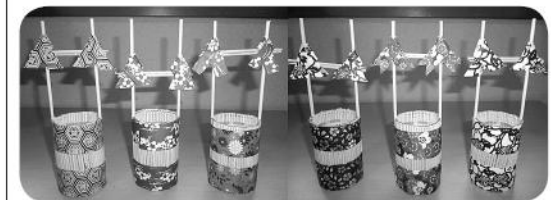
色柄がとてもきれいで、ステキに仕上がりました