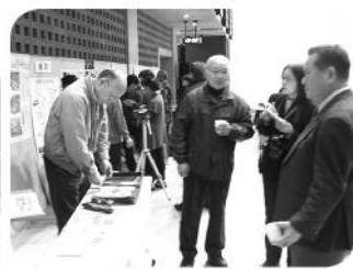
写真やDVD等、ふれあい会をわかりやすく紹介

1月27日(月)、すずの音ホールにて、第8回地区ふれあいサミットを行いました。この地区ふれあいサミットは、各地区ふれあい会で活動されているボランティアさんをはじめ関係される皆さんにお集まりいただき、情報交換等していただくものです。