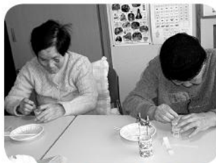
根気よくつまようじを並べます

予防デイサービスでは、乳酸飲料の空容器とつまようじを使って、小物作りをしました。一輪さしや小物入れに使えるように、皆さん一生懸命作りました。その結果とても素敵な作品が、出来上がりました。