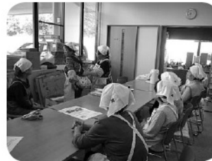
いざという時便利です

九月三十日(火)、ゆうあい館 において、福祉救済ボラの炊き 出し訓練を行いました。