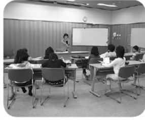
年間を通して手話の勉強