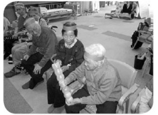
大豆の音もにぎやかです。」