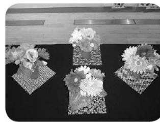
こんなにかわいく出来ました

初めてお目にかかる方や、昔なじみの方々と、ゆつくりと交流する事が出来、楽しいひとときを過ごす事が出来ました。