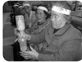
「がんばれ、がんばれ」