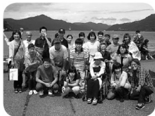
絶景をバックに記念の一枚

楽しかった希望の旅事業 手をつなぐ育成会等 希望の旅事業 八月三十日(土)～三十一日 (日)にかけて、静岡・神奈川 県方面へ行ってきました。 一日目は、富士サファリパー クへ行きました。バスに乗った ままパーク内を見学することが でき、間近に見る動物たちの迫 力に、皆さん大興奮されていま した。