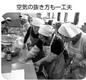
空気の抜き方も一工夫