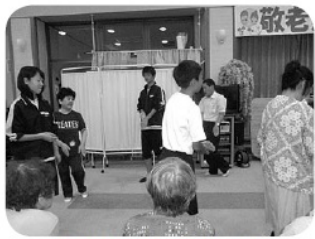
敬老会 踊りの輪に参加