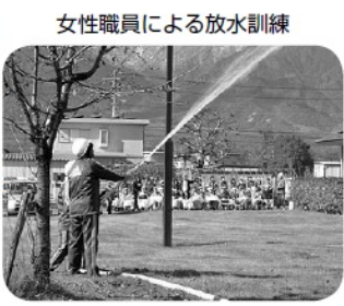
女性職員による放水訓練

Eメールアドレス mshakyo@coral.ocn.ne.jp 結婚相談ホームページ http://www.18.ocn.ne.jp/~msyakyu/