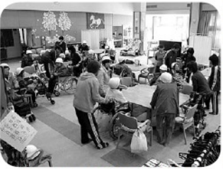
「落ちついて避難して下さい」