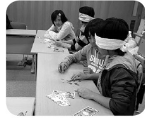
「10円のふちにギザギザがある」 新たな発見

十一月には、アイマスク体験 を行いました。介助者の誘導に あわせて廊下や階段を移動した り、アイマスクをしたままお金 を数える体験等を行いました。 「百円と十円の違いは、ふち にあるギザギザ」など気付くこ とがたくさんあったようです。