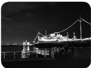
ステキな夜景が見られました

十月二十一日(火)～ 二十二日(水)にかけて、 神奈川・千葉方面へ出か けてきました。 一日目は、自分で食べ たいものを選ぶ自由昼食 を行い、サービスエリア で思い思いのものを選ん で食べていただきました。 また、横浜中華街での 買い物や食べ歩き、散策 を満喫していただいたり 夕食後は、山下公園へ夜 景を見に出かけました。