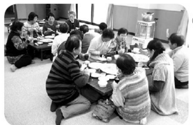
昨年のご苦労様会のようす

その他:ボランティア活動をされている方ならどなたでもご参加いただけます。美味しいおそば等食べながら、いろいろな活動をされている方とお話しましょう。