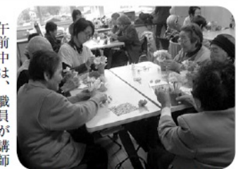
フラワーアレンジメント体験!!

ミニデイサービスでは、十月三十一日(金)に、全体交流会をすずの音ホールで行いました。日曜日から金曜日までご利用頂いているご利用者さま同士の交流会という事で、多勢の方々にお集まり頂きました。