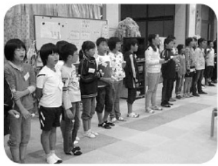
元気をたくさんもらいました