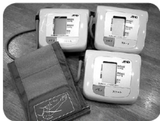
大きな字で見やすい血圧計です