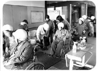
慌てず避難します

から声をかけ合い、お互いが交通安全に対して再確認できるように、意識していきたいと思えます。 また今回は、職員による放水訓練も行いました。いざという時に慌てず対応できるよう、日頃からの訓練が大切ということを再確認できた避難訓練となりました。