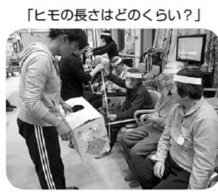
「ヒモの長さはどのくらい?」