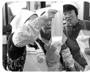
分量を確認します

日頃から意識や訓練すること が大切と改めて実感できる、貴 重な時間になりました。