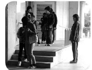
声かけの言葉の難しさを体験

十一月十八日(火)松川小学校の人權参観として、四年生のアイマスク・ガイドヘルプ体験が行われました。社協職員がガイドヘルプの仕方や声かけの大切さについてお話し、親子でペアになりアイマスク体験を行いました。普段は何気なく「こっち」や「ちょっと前」と言ってしまう