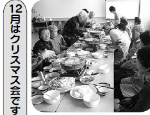
大勢での食事は美味しいです

たり、一緒に話をしたり歌をう たったりと、進んでご利用者さ んと接していただきました。