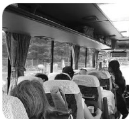
窓ごしの動物に大興奮!!

楽しかった希望の旅事業 手をつなぐ育成会等 希望の旅事業 八月三十日(土)～三十一日 (日)にかけて、静岡・神奈川 県方面へ行ってきました。 一日目は、富士サファリパー クへ行きました。バスに乗った ままパーク内を見学することが でき、間近に見る動物たちの迫 力に、皆さん大興奮されていま した。