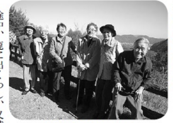
皆さんでパシャリ!!