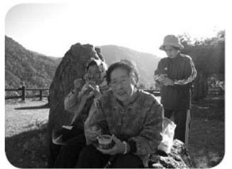
ゆっくりお茶を楽しみました

ふれあいサロンの皆さんの希望で今年も二日間、高瀬渓谷に紅葉狩りに行って来ました。途中、大町のレストランでそれぞれに好きな物をゆつくり頂いてから出かけました。二日間とも良い天気、恵まれ紅葉も丁度見頃で、みなさんとても