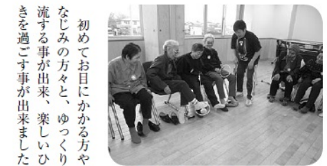
ゲームも盛り上がりました

初めてお目にかかる方や、昔なじみの方々と、ゆつくりと交流する事が出来、楽しいひとときを過ごす事が出来ました。