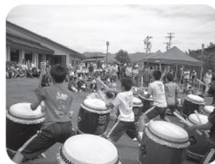
第 15 回ゆうあい祭り