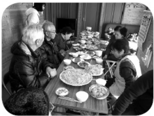
美味しくいただきました

1月 恒例のそば打ち、皆さんとても張り切っています。今年はボランティアア畑のソバが豊作だったので、この粉で打っていただいたら、とてもなめらかで風味のあるそばができました。おいしく、賑やかで、元気の出る会になりました。 2月 これも恒例となりました、やしょうま作りです。棒状に伸ばした米粉を筒状に重ね、切ってみたら見事な桜や椿のでき上がり。季節を感じながら、おしゃべりしながら、おいしくいただきました。