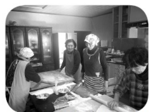
慣れた手つきで手早く打ちます