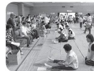
はつらつクリエイション交流会