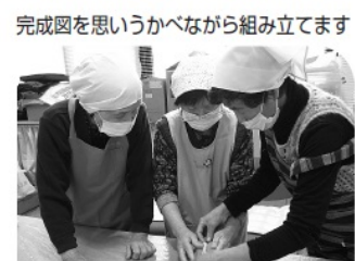
完成図を思いうかべながら組み立てます