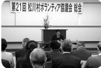
第21回 松川村ボランティア協議会 総会 H27年度について承認していただきました