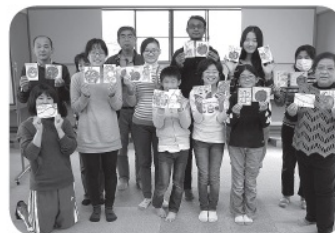
信州大学留学生さんとの国際交流 (小中ボラ) 絵手紙作り