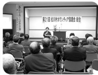
江森さんの優しい口調に引き込まれます