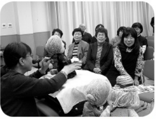
人形とのやり取りに会場内も和やかムード

また、3人の人形を使い、認知症の方とのやり取りを実演して下さいました。表情豊かな人形の行動に、「会場内は朗らかな雰囲気、ああそういうことだったのね」と声を出されながら、皆さん笑顔で参加されました。相手を尊重することの大切さや、人は誰かに助けられているという寄り添う気持ちを改めて考える貴重な時間となりました。