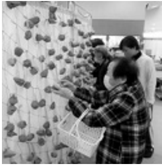
ゆうあい館のイチゴ畑です

デイサービスでは、4月、イチゴ狩りとお花見を行いました。イチゴ狩りでは、皆さん手づくのたくさんのイチゴで、大きなイチゴ畑をつくりました。イチゴ狩りが始まると「このイチゴがいいな。あの方がいいかな。美味しそうないちごだ」とまるで、本物のイチゴを取っているかのように。イチゴ狩りで堪能した後のイチゴのスイーツも、「とても美味しかった」と、ご満足でした。 今年もゆうあい館の桜が咲き、皆さんで見物。また、4月8日（木）、国営アルプスあづみの公園にも出かけ、ここでも桜を堪能されていました。「来年の