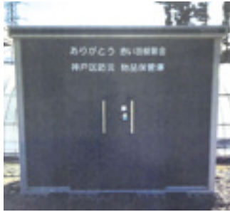
神戸区(防災物品倉庫)