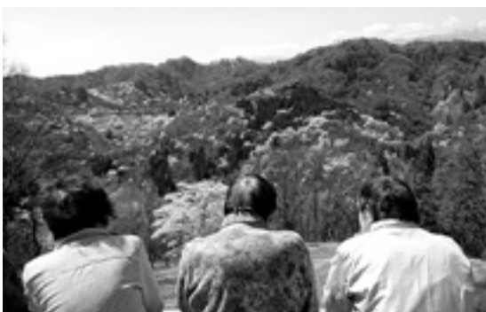
山の桜も美しいね