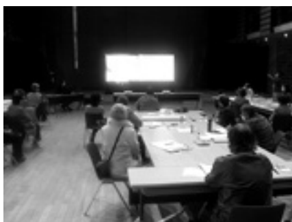
地区ふれあいサミット