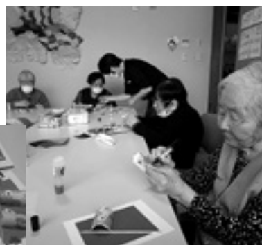
上手にできそうだよ

鯉のぼりも、それぞれに個性があり素敵に仕上がりました。作品は廊下に展示。通行する皆さんにご覧いただきました。