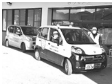
子どもを守るパトロールボランティア