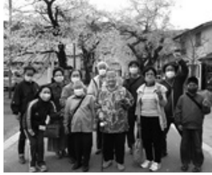
来年も見に来ようね

4月27日(火)、毎年恒例のお花見に出かけました。あいにくのお天気ではありましたが、久しぶりの外出に、自然と皆さんの顔がほころびます。 車内から見える山や道ばたにも色とりどりの花が咲いており、春を感じながら目的地へ向かい