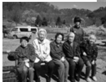
お天気が良くて暑いぐらい