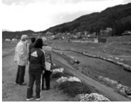
芝桜もきれいだね