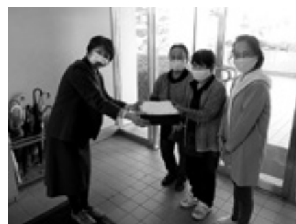
手工芸ボランティア