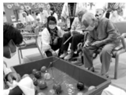
デイサービス夏祭り