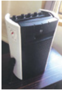
北細野区(ワイヤレスマイクとアンプ)

令和2年度、社会福祉法人「長野県共同募金会」が所管する、安心・安全なまちづくり活動公募配分事業へ申請を行い、神戸区、北細野区に配分が決定しました。それぞれ、防災物品倉庫、ワイヤレスマイクとアン