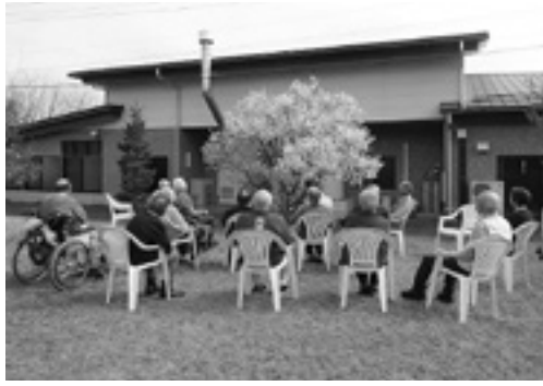
ゆうあい館の桜も、小ぶりだけどきれいだね

デイサービスでは、4月、イチゴ狩りとお花見を行いました。イチゴ狩りでは、皆さん手づくのたくさんのイチゴで、大きなイチゴ畑をつくりました。イチゴ狩りが始まると「このイチゴがいいな。あの方がいいかな。美味しそうないちごだ」とまるで、本物のイチゴを取っているかのように。イチゴ狩りで堪能した後のイチゴのスイーツも、「とても美味しかった」と、ご満足でした。 今年もゆうあい館の桜が咲き、皆さんで見物。また、4月8日（木）、国営アルプスあづみの公園にも出かけ、ここでも桜を堪能されていました。「来年の