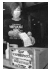
マスク回収ボックス