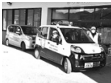
青色回転灯パトロール