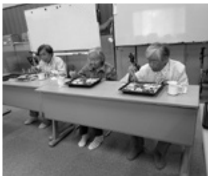
とても美味しいね

今回注文させていただいたお店の方々のご協力を改めて感謝を申し上げます。コロナに負けずに頑張りましょう。