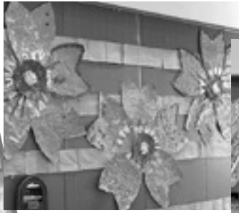
いずれも入賞した壁画です

壁画づくりもそのひとつですが、利用者の皆さんが作ってくださった壁画を、「月刊デイ」という介護専門誌の「レク・クラフト募集」コーナーへ応募し