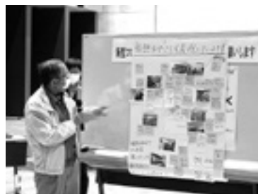
様々な活動ができそうです