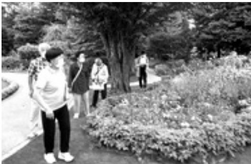
6月 ナチュラルヒーリングガーデン

歩入ると、色とりどりの花や樹に囲まれ、澄んだ小川が流れ、別世界にきたような癒しの空間でした。散歩の後は一気に安曇野市まで行き、思い思いのジェラートを満喫しました。