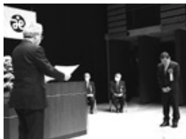
福祉功労者表彰式

日頃から、松川村社協の事業へのご理解とご協力をありがとうございます。 理事会・評議員会において、令和2年度事業報告、会計決算が承認されました。 主な事業などをお知らせします。