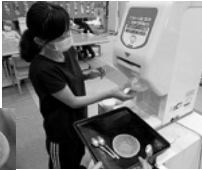
作りたてのアイスですよ

また、毎年開催していた夏まつりに代わり、今年は、ささやかですが「お楽しみおやつ週