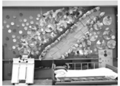
今年の7月の壁画です

ています。その結果として、いくつも入賞（写真参照）し、本誌に掲載されています。このことと一生懸命作成した努力が認められ嬉しい限りです。