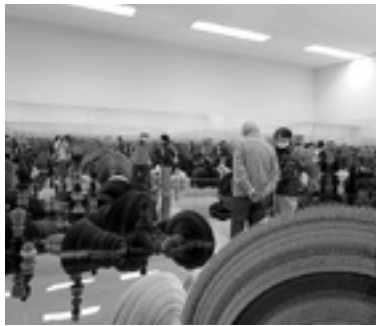
10月 北アルプス国際芸術祭にて

成させた無添加の三年味噌をつくっています。麴のいい香りがする蔵の中に、大人の背丈の倍ほどある杉桶がいくつも並んでいます。見学では、味噌の違い