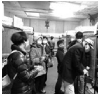
12月「石井味噌」の味噌蔵にて

や作り方を教えていただきました。久しぶりの昼食会では、三年味噌を使ったおいしいお料理を、お腹いっぱい味わって帰ってきました。