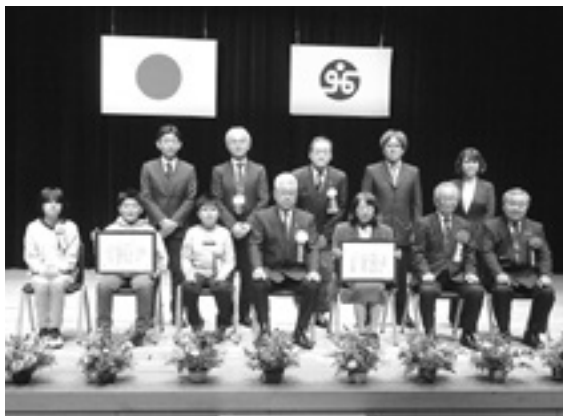
表彰された 皆さん

多年にわたり、村手をつな ぐ育成会および当協議会の事 業に貢献され、地域福祉の発