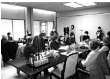
しばらくぶりで楽しみです

現在は、感染レベルが落ち着いているため久しぶりの交流会となりましたが、「スーパーで会っても話もできない、できたら年に2〜3回くらいこの集まりをやってほしい」という希望が多くの方から寄せられました。来年度の計画に反映していきたいと思えます。