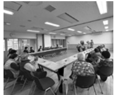
花笠音頭に大喜びです

今後の「ともだち広場」でも、芸能ボランティアをお願いする予定です。楽しくお喋りする時間もありますので、お一人暮らし