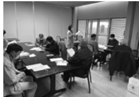
青色・回転灯パトロールボランティア

健康維持にとっても効果的であるという内容で、貴重なお話しをいただきました。 健康講話の後は、日々の活動の反省や振り返りとともに意見交換などが熱心に行われ、次への糧にされています。