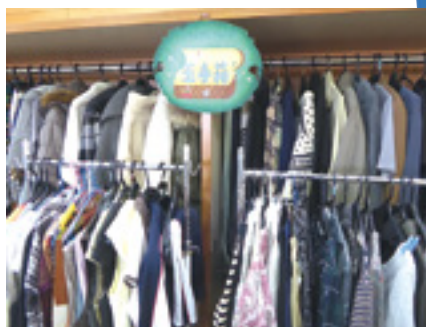
「玉手箱」は、ロビーの北側にあります

皆様のご提供、ご利用をお待ちしています。 また、売上金は、世界で衣料支援を必要とする人たちに衣料を寄贈する日本救済衣料センターへも玉手箱から衣料を送っており、その送料に充てています。皆様のご提供、ご利用をお待ちしています。