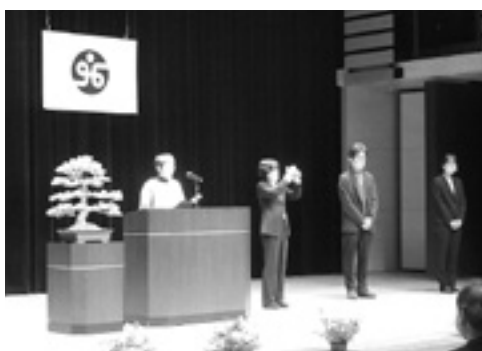
朗読教室および手 話教室の皆さんに よる活動発表