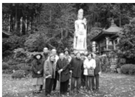
満願寺でのひとコマ

学し、地域の方々が育てた見事な菊に感心していました。コロナ禍の中だからこそ、人と人のふれあいが一段と大切