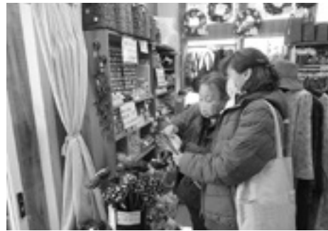
手芸ボランティア

健康維持にとっても効果的であるという内容で、貴重なお話しをいただきました。 健康講話の後は、日々の活動の反省や振り返りとともに意見交換などが熱心に行われ、次への糧にされています。