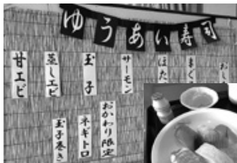
お寿司週間のメニューです