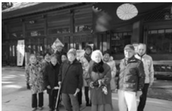
穂高神社本殿にて

ふれあいサロンは、毎週水曜日、お一人暮らしなどのご高齢の方々がご参加いただける交流の場として活動しています。サロンとして取り組む内容は参加者の皆さんで話し合い、有意義