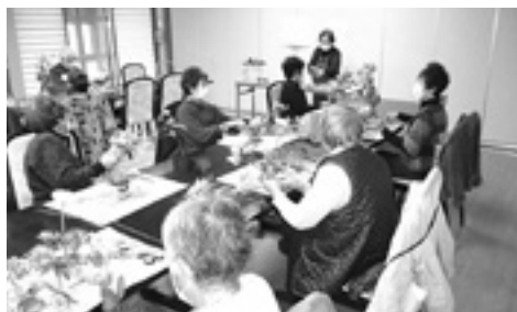
一人暮らし高齢者交流会