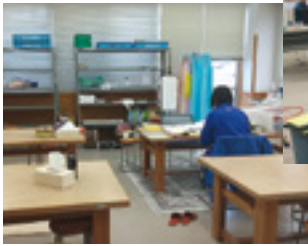
ヘルパーサテライト ステーション