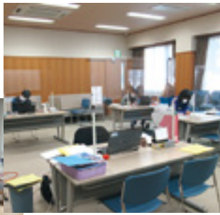
総務・地域福 祉係の分室

地域に目を向けていただいた 優しいお気持ちに改めて感謝を 申し上げますとともに、大切に 使わせていただきます。