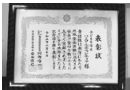
青色回転燈パトロールボランティアへの県からの表彰状