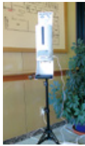
寄贈された固定式 非接触検温付オート ディスプレイ

入口3ヶ所と、地域福祉事業お よび介護保険事業を中心に、新 型コロナウイルス感染症対策と して活用いたします。地域の皆 さまが安全安心に社会参加がで き、また継続できるように今後 も努めてまいります。