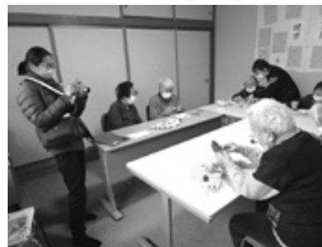
大系タイムスの取材中です

を受け記事にもしていただきました。ミニデイサービスでは、日頃から、利用者の方々の自主性を尊重しながら、運動やレクリエーションなどを通じて機能の向上を応援していきます。