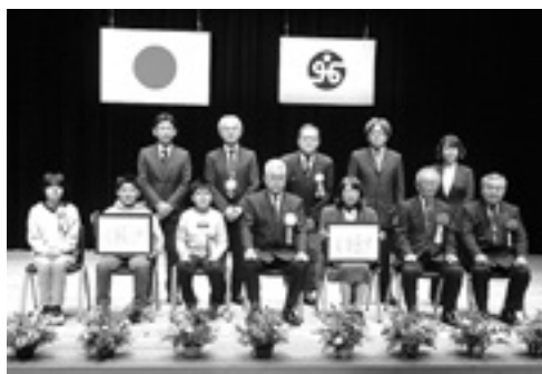
松川村社会福祉協議会福祉功労者表彰