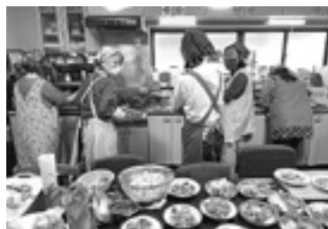
こどもカフェ調理の様子