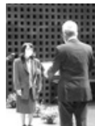
福祉功労者表彰式