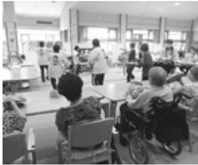
オリジナルの花笠音頭を皆さんで

敬老週間では、職員からの歌と、オリジナルの花笠音頭の踊りをプレゼントしました。花笠音頭は皆さんとも一緒に踊り、大いに盛り上がりました。敬老週間に合わせた食事は、盛りだくさんの特別メニュー。村内のお店から購入した和菓子も美味しくいただきました。デイサービスでは、利用者の方々が元気で楽しみただけのように、さまざまな催しを行います。