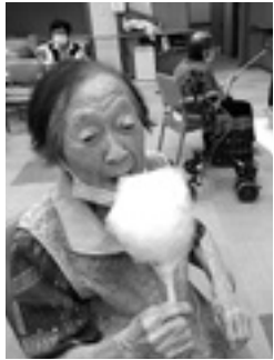
なつかしい味だね

夏まつりは、ぼんぼんつり、わたあめ、アイスクリームの味を決める輪投げを楽しんでいただきました。ぼんぼんつりでは、1回に3つもつり上げて糸が絡まってしまい一同爆笑。わたあめは、昔なつかしい味でほっとしました。アイスクリームは「バナナがいい、抹茶がいい」、とても賑やかに、「美味しいー」と喜ばれました。