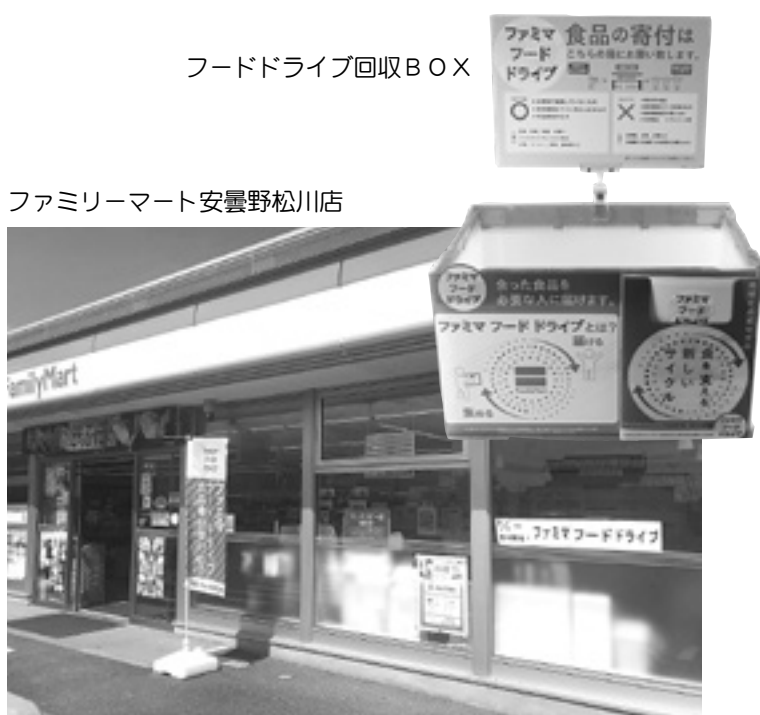
ファミリーマート安曇野松川店