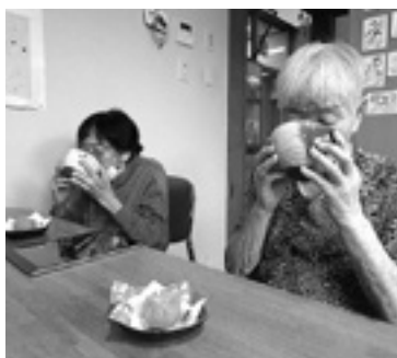
何か、ほっとするね

「なかなか、美味しいね」「気持ちにゆとりができるね」など、とても好評でした。次は、がんばる松川村応援券