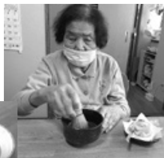
上手にたてられたよ

を使つての外食も計画しています。ミニデイサービスでは、今後も楽しみながら健康を保つことができるサービスを提供していきます。