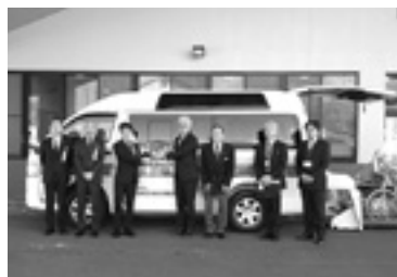
移送サービスカー寄贈される

日頃から、松川村社協の事業へのご理解とご協力をいただきありがとうございます。理事会・評議員会において、令和 3 年度事業報告、会計決算が承認されました。主な事業などをお知らせします。