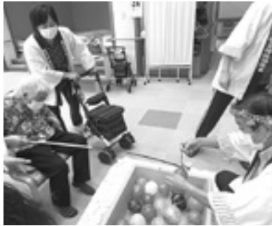
あっ、からまっちゃった