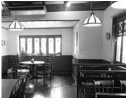
陶苑の店内はクラシカルな雰囲気です

9月は、敬老週間のイベントとともに、「お抹茶会」を行いました。やはり「本格的にやってみたいね」ということ