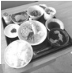
盛りだくさんなお食事です