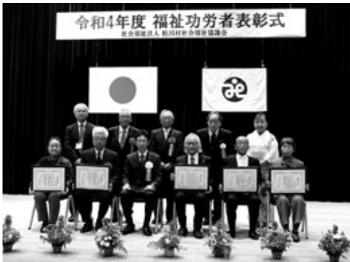
表彰を受けられた 皆さん

すずの音応援団 発足当初より、 ガーデンクラブの 代表として、また 芸能ボランティア として地域福祉推 進のためご尽力さ れました。