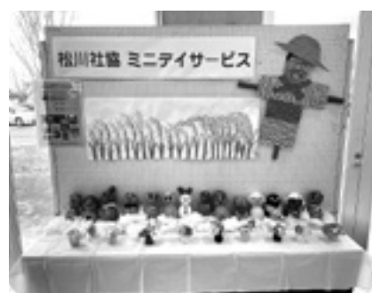
文化祭への出展風景です

援をしています。今年も、毎年好評の紅葉見物に池田の長福寺へ出掛け、改めて大銀杏の大きさに感心しきりでした。また、元気な体で生活を維持していただくために、さまざまな健康体操や歩行練習などを