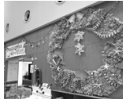
大きな大きな(直径2m)リースです

例年、クリスマスシーズンは松川小中学校や保育園の皆さんと交流を行っています。コロナ禍の影響で実現できていません。そのような中、中学生の福祉体験教室(裏表紙参照)で学習をした生徒さんから、自分たちで制作した健康体操ビデオをいただきました。利用者の皆さん、早速ビデオに合わせて、元気に体を動かしていました。中学生の皆さん、ありがとうございました。