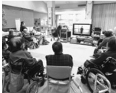
皆さん、熱心に健康体操をしていました