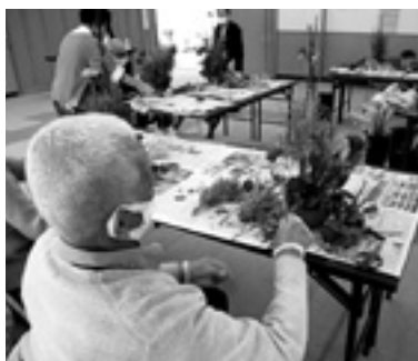
12月 うーん、おずかしいな

方からは、「来て良かった」との声をいただきました。介護者交流会は、毎月第4火曜日に開催しております。ぜひご参加をお待ちしております。