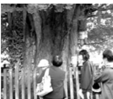
10月 ほんとはに大きいね

シスのどこに花を挿そうか」から始まりましたが、ひと挿しすると迷いはなくなり、それぞれ自由に楽しく作ることができました。今回初めて参加された