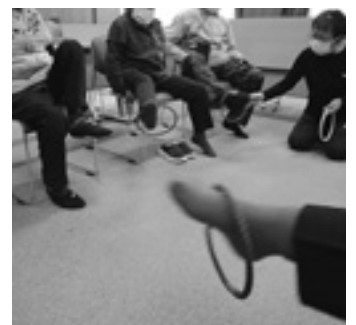
よいしょ、一生懸命です

シスのどこに花を挿そうか」から始まりましたが、ひと挿しすると迷いはなくなり、それぞれ自由に楽しく作ることができました。今回初めて参加された