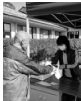
ありがとうございます

当日はフードドライブでいただいたお米を使ったおにぎりをはじめ、食品や野菜等を配布しました。来場者には「とても助かる」と好評をいただきました。