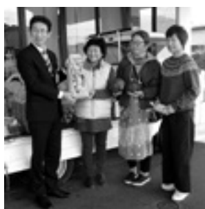
皆さんが提供してくださった生活改善グループの皆さんが、ありがとうございました

当日はフードドライブでいただいたお米を使ったおにぎりをはじめ、食品や野菜等を配布しました。来場者には「とても助かる」と好評をいただきました。