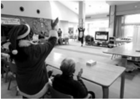
ジングルベール、ジングルベール、鈴が鳴る～

利用者の皆さんが元気で楽しんでいただけるよう、壁面づくり、健康体操やゲームなどさまざまなレクリエーションを行っています。クリスマス会に合わせて、壁面のリースづくりを行いました。皆さん、リースの材料をこつこつとたくさんつくっていただき、こんなに大きなリースになりました。表紙の干支の壁画も、「飛躍の年になれ」との思いが込められています。