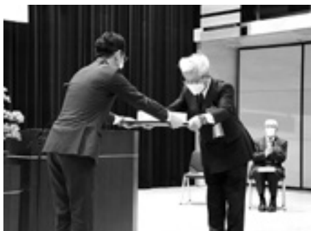
会長より表彰状を 受ける受賞者