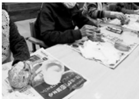
上手に貼れそうだ