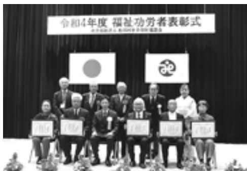
松川村社会福祉協議会福祉功労者表彰