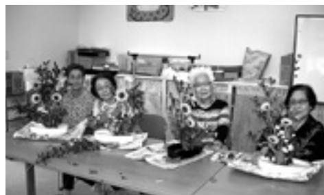
お花のボランティア