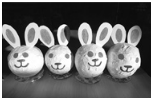
皆さん、今年も元気でね

デイサービスでは、利用者の皆さんが元気で楽しんでいただけるよう、壁画づくり、健康体操やゲームなどさまざまなレクリエーションを行っています。これからも、たくさん楽しんでいただけたらと思います。