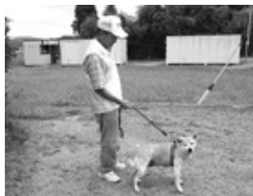
わんわんパトロール