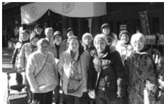
今年も良い年でありますように

当事業は、お一人暮らしの高齢者の方々などにご参加いただける交流の場です。参加者からは「皆さんと話す時間がとても楽しみ。ふれあいサロンの時間が生きがいです」との声も伺い、皆さんの元気の源になっているようです。毎週水曜日、ゆうあい館で活動中です。ご興味のある方は、02-9000までお問い合わせください。