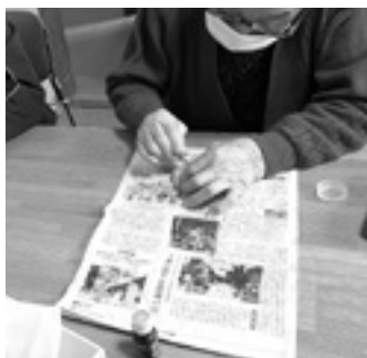
よく混ぜないと、滑らかなクリームができないよ

を行っています。先日、ハンドクリームづくりに挑戦しましたが、材料の配合が難しかったのですが、最後にオレシオイルで香り付けをして完成。皆さん、早速手に付けマッサージをしていました。