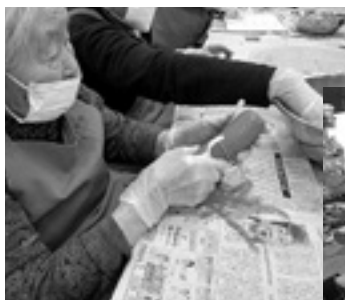
美味しいカレーをつくるよ

う」と決めました。「いつまでも元気でいたい」という願いが込められた目標になりました。