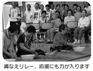
縄なえリレー、応援にも力が入ります

トボトルの口を上下でつなげ、大豆を上から下へ落とす大豆落としゲーム等、どの種目も熱戦をくり広げていただきました。