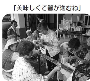
「美味しくて善が進むね」

願いを込めて デイスリーブスの七月のレクリエーションは、七夕飾りを作り、短冊には思い思いの願いを込めて書いて頂きました。 もちろん笹の葉なども手作りして頂き見事な出来栄えに本物と見違うほどです。