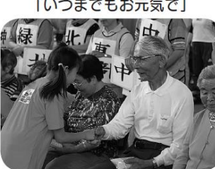
「いつまでもお元気で」

抜いたヒモを繋げて長さを競う運が勝負の「抜いてビックリ」では、ヒモを抜くたび歓声や笑いがあり、自分の地区に関係なく応援をされていました。