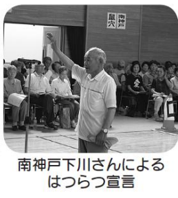
南神戸下川さんによるはつらつ宣言

七月二日(土)、松川村生涯学習センター「グリーンワークまつかわ」において、第35回はつらつレクリエーション交流会が行われ、二百人を超える皆さんにお集まりいただきました。