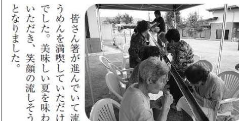
「大勢で食べるから美味しさも増すね」

「外で遊べない」「食べ物に制限がある」など、不安で不自由な生活をしている福島の子もたち。長野県に来て、外で思いきり遊んだり、バーベキューや花火をしたり、スポーツをしたり、「好きなことが思いきりできる」楽しみを味わっています。 少し前まではそんなことが当たり前だった子どもたち。松川の子どもたちは今、思いきり遊ぶことができます。そんな彼らが、「自分たちにできること」として義援金お願いの活動をしました。 引き続き役場、ゆうあい館で行っていますのでよろしくお願ひします。