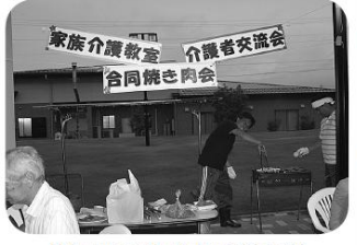
「焼きたてのお肉をどうぞ」