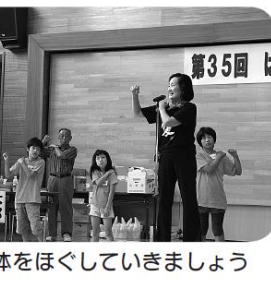
体をほぐしていきましょう