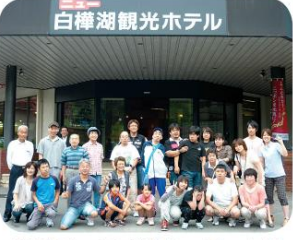
皆そろって「はい、チーズ」