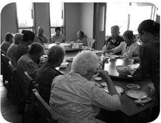
「大勢で食べるご飯はおいしい!!」

毎週第4水曜日 すずの音ホール 10:00~14:00 みんなでおいしく 楽しく、食事しましょう