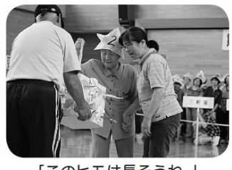
「このヒモは長そうね。」