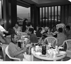
美味しいお肉で元気回復!!

毎日「真夏日、猛暑日のアツイ日」をぬうように、台風の影響で少し涼しくなったある夏の夜、日頃在宅で介護をされている皆さんやOBの方がゆるあい館へ集まり、今年も賑やかに焼肉会を行いました。