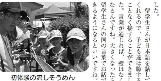
初体験の流しそうめん

第十七回国際交流 七月十六日、小学生ボランティア教室の子ども達と信州大学留学生のみなさんとの交流会が行われました。今年、アメリカ、韓国、中国、ベトナム出身の学生さん五名が参加して下さいました。 今回の交流会のメインテーマは、「いっしょにあそぼう!!」です。 韓国流すころくや、ハンカチ落とし風ゲーム「ダックダック・グース」など、各国の遊びを教えてもらい、夢中になってあそびました。留学生さん達も手加減なしで、いろいろなお話をしながら食べました。 おながすいたら、昼食は流しそうめんとバーベキューです。すっかり仲良しになったので、いろいろなお話をしながら食べました。 とっても仲良くなりました。