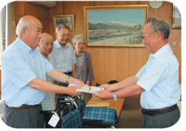
社団法人日本禁煙友愛会 信濃松川支部 介護用車イス等

◎一般会費 1口...1,000円 ◎賛助会費 1口...2,000円 ご協力をよろしく お願い致します。