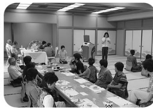
「ゆっくり会食しましょう」