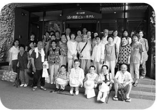
交流を深めていただきました。

今回は村を離れ、自然の中で楽しんでいただいた後、穂高ビューホテルにて「おひさま御膳」をいただきました。ボランティアさんと利用者さんとのふれあいの場になる様、普段お話しした事のない方とも関われる様に、席決めのお引き等を用意してみました。