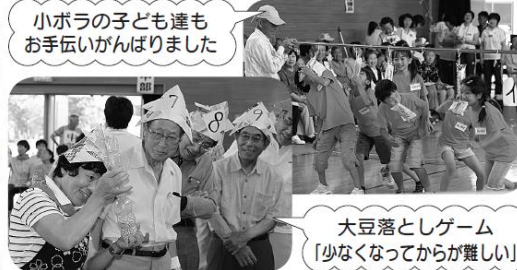
小ボラ子ども達もお手伝いがなりました