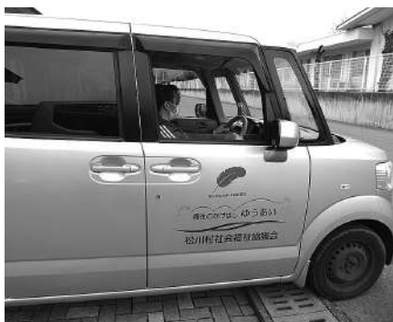
訪問に行ってきまーす!!

急な体調不良などにも対応可能です。隙間時間を活用して働きたいなど、1時間からの勤務も可能です。自分のライフワークに合わせて働いてみませんか？まずはお話からでもいいです。お気軽にお問い合わせください。●社協《ヘルパーステーション》電話62-9000