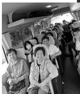
ねずみ穴ふくふく会