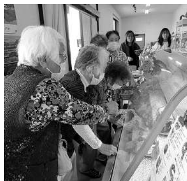
どれにしようかな

クニックススタイルの風食に大満足です。これからも楽しみながら健康を維持できる企画を、皆さんに提供してまいります。