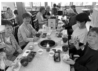
中部なかよし広場