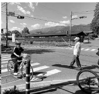
はいっ、気をつけて