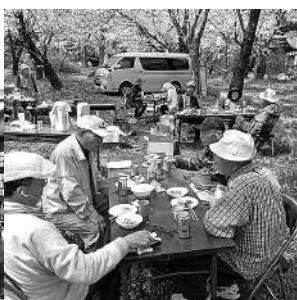
北細野つくしの会