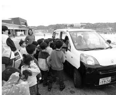
青色回転灯パトロール