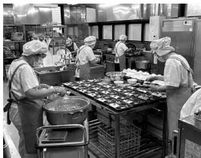
まめまめ弁当ボランティア