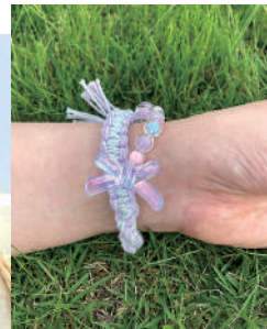
手づくりプレスレット

MAGとおにぎりワークスワークショップのコラボ企画、第2弾です。糸やビーズを選んで編む、自分だけのプレスレットつくりませんか? お申込み、お問合せは…電話(62)9000 ・日 時:8月6日(水) 14時~15時30分頃