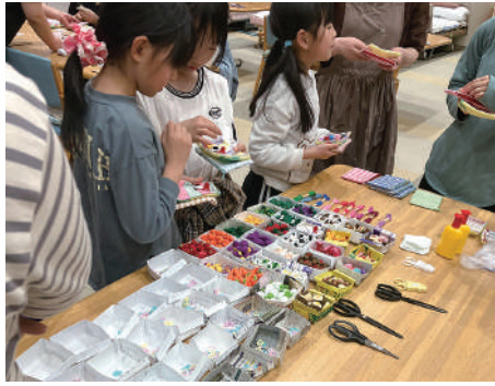
3月開催 クラフトワークショップ

就労継続支援A型事業所おにぎりワークスの皆さんを講師にお招きし、オリジナルポーチづくりワークショップを開催しました。