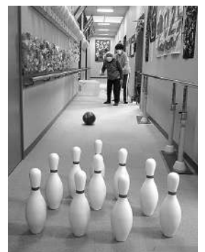
フロアボウリング