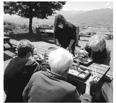
外での食事は気持ちいいね

などに対してアドバイスをいただきました。貴重なご意見は、今後のサービスにつなげられるよう活かしていきます。