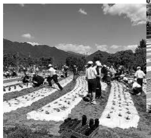
ちひろ公園大花壇