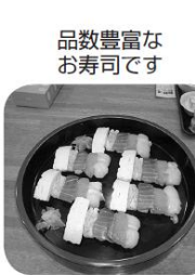
品数豊富なお寿司です