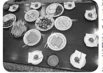
美味しいお茶うけに、話もより深まりました。

社協では毎月昼と夜の二回、在宅で介護をしている皆さんや、介護を終えられた皆さんに集まって頂き、勉強会や交流会を行っています。是非お誘い合っご参加下さい。