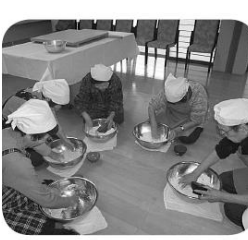
「とてもきれいなそば粉だね」

介護者交流会 今年初めの交流会は、恒例となっているそば打ちを、すずむし荘で行いました。 そば打ちの得意な介護者の方から教えていただきながら、五枚のそばをあっという間に、打つことができました。 そば打ちの後の昼食会では、ご自分で打ったそばを召し上がりながら、日々の介護についてや、車椅子でも利用がしやすい店の情報などが話題になりました。