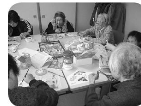
もうすぐ完成です。