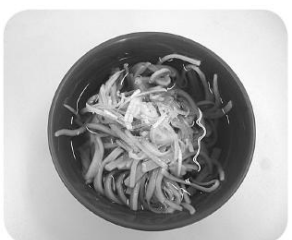
のどごしのよいおそばでした。

今年もボランティアで収穫したソバ粉を使って、1月15日(月)21日(日)の二週間、職員が打ったソバ汁をご利用者さんに召し上がって頂きました。 打ちたてのおソバの味は格別で、皆さん「おいしいね!!」「毎年楽しみに」とおっしゃって下さいました。おいしいおソバに、皆さん箸が進んだ様子で、おかわりの声をたくさん頂くことができました。旬の味を十分堪能して頂けた様でした。