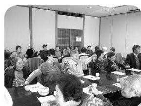
「大勢の食事は、より美味しいね」 楽しいゲームで交流を深めました。