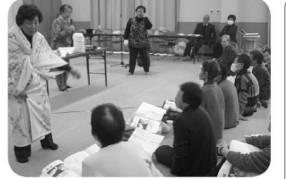
毛布であったか丹前づくり