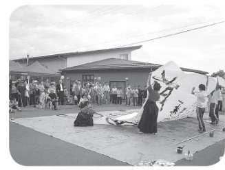
第13回松川村ゆうあい祭り