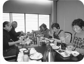
「自分達でうったおそばは とても美味しい」

介護者交流会 今年初めの交流会は、恒例となっているそば打ちを、すずむし荘で行いました。 そば打ちの得意な介護者の方から教えていただきながら、五枚のそばをあっという間に、打つことができました。 そば打ちの後の昼食会では、ご自分で打ったそばを召し上がりながら、日々の介護についてや、車椅子でも利用がしやすい店の情報などが話題になりました。