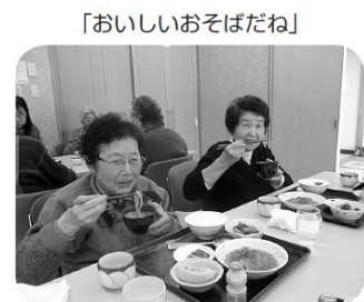
「おいしいおそばだね」