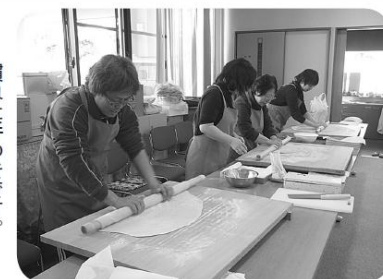
慣れた手つきです。

今年もボランティアで収穫したソバ粉を使って、1月15日(月)21日(日)の二週間、職員が打ったソバ汁をご利用者さんに召し上がって頂きました。 打ちたてのおソバの味は格別で、皆さん「おいしいね!!」「毎年楽しみに」とおっしゃって下さいました。おいしいおソバに、皆さん箸が進んだ様子で、おかわりの声をたくさん頂くことができました。旬の味を十分堪能して頂けた様でした。