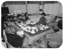
こたつを囲んで ゆっくりとした時間でした

お漬物の話から始まった交流会 は、自然に介護に関する話題に移っていききました。ある介護者OBの方からは、介護を終えられた後の日常生活を話していただきました。 最後には、新春ビンゴゲームを楽しみ、盛り上がりました。