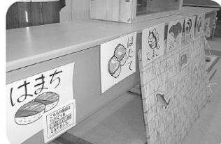
おいしいお寿司のおかわり行列ができました。

今年一年、皆さんが健康で元気に過ごせますように、願いを込めて、ゆうあい館に飾らせていただきました。