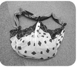
大ふるしき2枚を使って→便利リュックの出来上がり