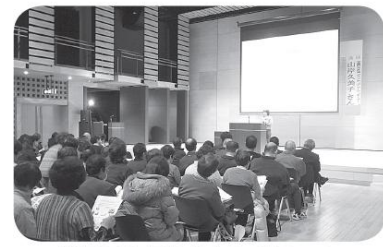
第7回地区ふれあいサミット