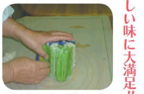
まさに芸術品!! どんな絵柄になるか楽しみです。

おいしいお米、ありがとう 松川小学校3年生安曇野まつかわ農業小学校の皆さんより、アイガモ農法で育てた無農薬コシヒカリをいただきました。 まめまめ弁当や利用者さんのお昼にいただき、食べた方からは、「おなかもちもちもいっぱいになった。本当においしかった。ありがとう。」と、たくさんさんの声をいただきました。