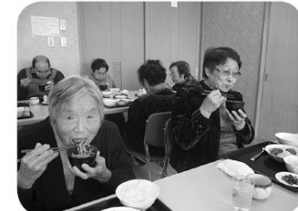
「毎年楽しみにしてるよ」