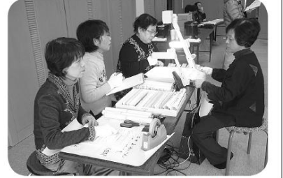
耳の不自由な方に要約筆記を

ボランティア活動保険に入りましょう。 ボラ活動中の事故が補償されます。 300円(年間) (社協補助でBプラン(450円)に加入します) 3月手続きで4月からスタート 安全・安心のため、必ず加入しましょう。 社協・ボランティアセンターで受け付け中。 (保険継続の方も おいでください。) 電話 ゆうあい館 (62-9000) 花ボラさん アレンジフラワー 総会を盛り上げます。