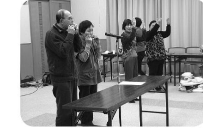
ハーモニカ伴奏で手話による歌唱(ふるさと)