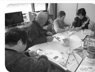
願いを込めて作成中