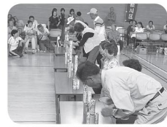
はつらつレクリエーション交流会