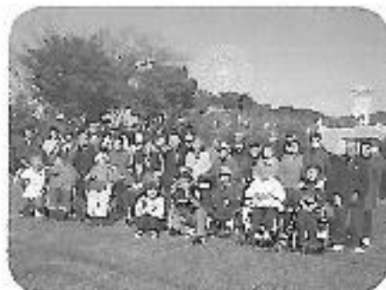
希望の旅事業（知的）