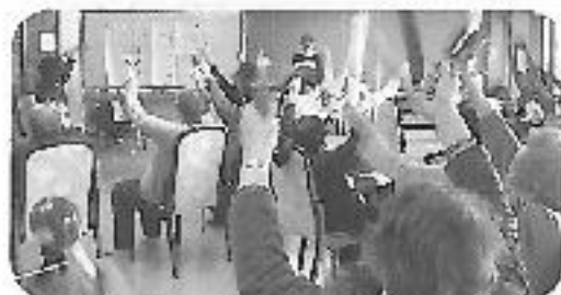
ピアノにあわせて体を動かします。