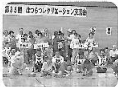
平成23年度の交流会の様子

今年度も「はつらつしぐりエーシヨ」 （シンク交流会）を開催します。 詳細等については、後日実行 委員会において最終のご決定し たいと思っておりますので、楽しみに お待ち下さい。