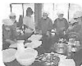
ヘルパーによる料理講習

学研会やリフレッシュすることにより、介護者さん同士の話し合いの場にもなったり、気分転換をし介護の疲れが忘れられるようなイベントが待ってたらと思っております。村にお住まいで介護をされている方ならぜひ参加いただき、一緒に活動だけでも、是非ご参加下さい。