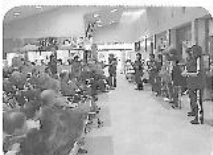
歌員の演奏にあわせて利用者さんの歌声が響きます

ふれあいサロンではこれから音楽をとり入れたレクリエーションで心も体も元気に過ごしたいと思っています。