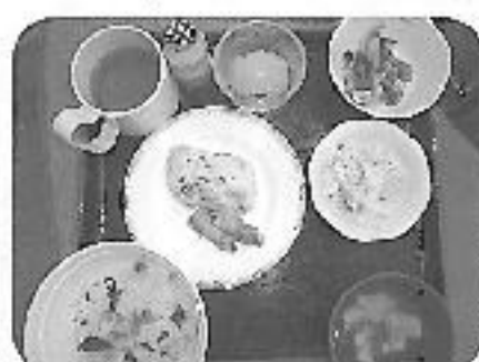
お花見昼食に舌鼓

午後は「春の小川」の合奏、役員は「花笠音頭」の踊りや、「花」の二部合唱を行って、にぎやかな時間を過ごしました。利用者さんにも喜んで頂いたので、これからも色々な行事を企画していきたいと思っております。