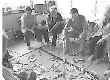
「どの魚をねらおうかな」

ふれあいサロンではこれから音楽をとり入れたレクリエーションで心も体も元気に過ごしたいと思っています。