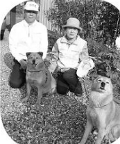
すーちゃん・ひーちゃんです (北細野区)