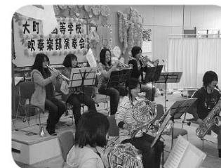
ゆうあい館中に響きます

初めて来られた方も多く、「食事が美味しかった」「また来たいね」と喜んでいただくことができました。