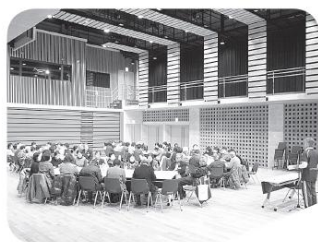
地区ふれあいサミット

平成22年7月17日(土) 午前8時50分～正午 多目的交流センター すずの音ホール 主催：松川村・松川村社会福祉協議会