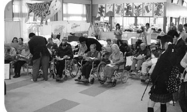
学生さんの生演奏にあわせて歌いました