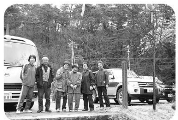
お花見ドライブで「ハイ、チーズ

お花見あり、外食あり。お出かけも楽しみな行事です。お昼は、季節の材料を使ってボランティアさんの心のこもった献立。多勢で食べれば、味もアップ。食欲もアップです。