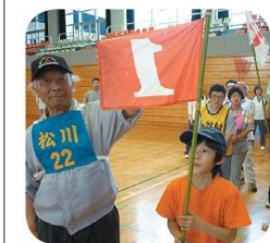
見事1等賞!! 松川小ボラの子とパチリ