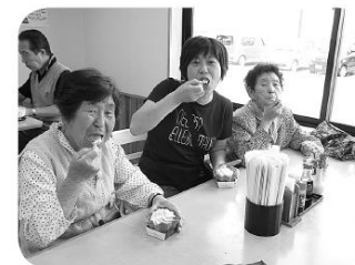
食後のデザートに笑顔

格安なのにボリューム満足のメニューがたくさんあり、その中で、ふれあいサロンの皆さんには、おにぎり定食と天丼が大人気でした。