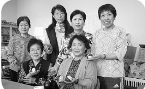
お手玉作り好評でした。