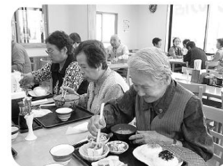
見た目も量も大満足

四月二十四日(土) ゆうあい館において、大町北高等学校吹奏楽部の皆さんによる演奏会が行われました。「信濃の国」や「おぼろ月夜」など懐かし曲をたくさん演奏してくれて、ご利用者さんも一緒に歌ったり演奏に聞き入ったりとても喜ばれていました。また最後には、今月のお誕生日の方のためにと「ハッピーバースデー」の演奏をしてく