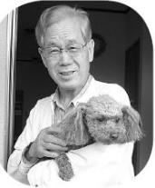
クーちゃんです(東松川南区)