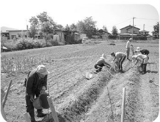
今から収穫が楽しみ!