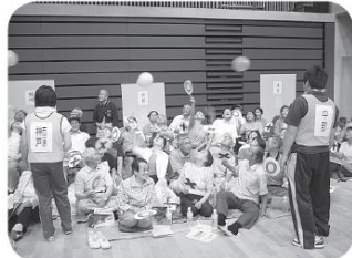
風船を落とさないようにあおぎます