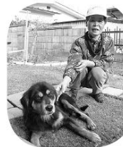
マリです (東松川南区)