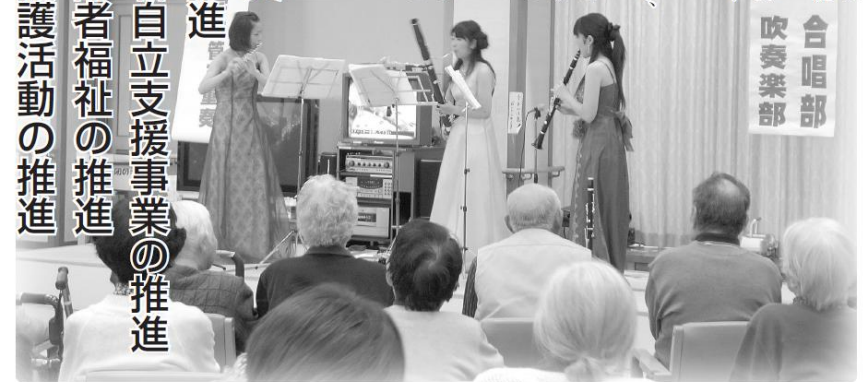
松川中学校 合唱部 吹奏楽部

少子高齢化や人口の減少の進行、世界的経済危機による社会不安の増大などにより、社会福祉を巡る環境は厳しさを増しています。 このような状況のなか、地域社会においては、社会的不安の増大、人間関係の希薄化による社会的排除や孤立の増加、制度の狭間にある要支援者の存在など、新たな福祉課題が増大しています。これらの課題は、公的サービスだけでは十分に対応できないものも多く、地域で住民自身が行う活動が大切になっています。 これらの地域福祉の推進のためには、施策の充実とともに、住民相互の「気づき」や「つながり」による新たな「支え合い」のできる地域づくりが重要になってきます。 松川村社会福祉協議会は、こうした状況を踏まえ、各種団体・機関と連携を図り、改めて住民同士の「つながり」や「支え合い」を見直しながら、福祉コミュニティ作りを目指します。