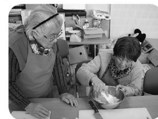
分担しての調理中