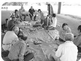
畑仕事の後のお茶も楽しみです