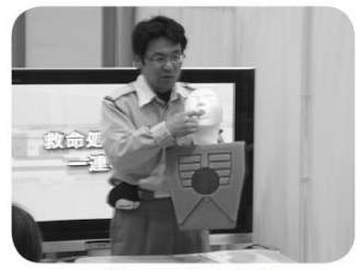
いざという時のために