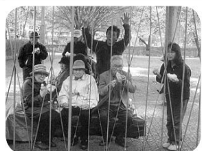
4月満開の桜の下で。「オリの中？」