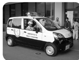
青色回転灯パトロール