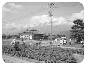
畑作業日和になりました

散歩している方がいるとします。「ボタンが開いたね」「これからちょっと駅前まで行つてきます」といった、何でもない日常の会話を交わすお知り合いです。 ある日、いつもの散歩でお顔を見ると、どこかいつもと違う。話しても返事がこない。相手の方に変化が起こっているかもしれない。いつもより少し余計に心配りしてみましよう。 そんな見守りサポーターの勉強を開催します。ぜひご参加下さい。