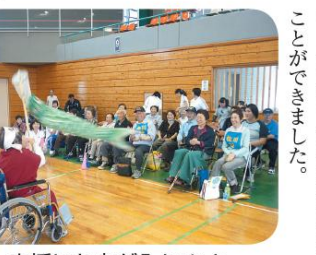
応援にも力が入ります。

六月五日(土)、大町運動公園体育館において、大北障がい者運動会が行われました。当日は大勢の方に参加していただき、様々な種目を通して、交流を深