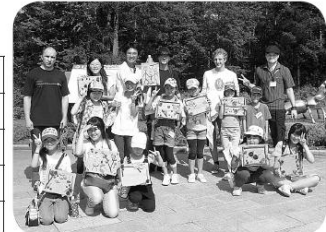
信州大学留学生との国際交流